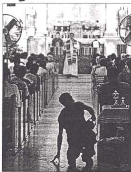
Un hombre se arrodilla al fondo de la iglesia, en una misa católica realizada por los viajeros inmigrantes el año pasado en Altar, México. En su búsqueda de sobrevivencia económica, los inmigrantes también se arrodilan en su jornada religiosa. A man kneels at the back of a Catholic Mass held by migrant travelers last year in Altar, Mexico. On their trek for economic survival, migrants kneel during the religious journey.

En un momento de fe y tragedia en un viaje a Estados Unidos.